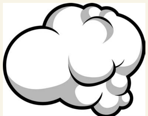
Не допускайте курение в квартире, где проживает ребенок. Дети курящих матерей в 5 раз чаще подвержены риску внезапной смерти