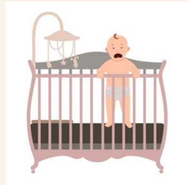
Не оставляйте младенца без присмотра