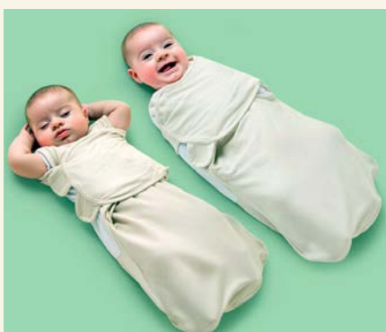
Используй свободное пеленание