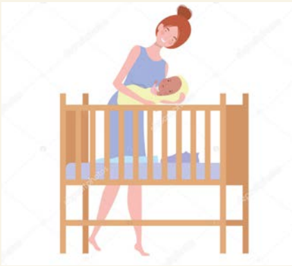
Младенец должен находиться под присмотром взрослых