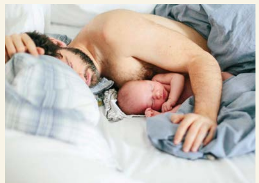
Не кладите ребенка в одну кровать с собой или старшими детьми