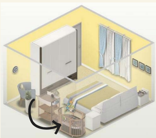
Детская кроватка должна стоять в спальне родителей Не кладите в кроватку мягкие игрушки, подушки, бортики Оптимальная температура воздуха в спальне +20-22 °С