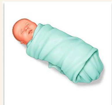
Не используйте тугое пеленание